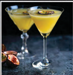
PORNSTAR PROSECCO / 45 ZŁ

TEQUILA, TRIPLE SEC, SYROP WANILIA, SOUR MIX, PUREE PASSION FRUIT, MIĘTA, LIMONKA, PROSECCO