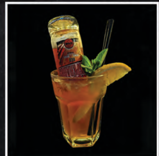
RED TEQUILA / 60 ZŁ

TEQUILA, TRIPLE SEC, SYROP HIBISKUS, SOUR MIX, POMARAŃCZ, LIMONKA, PROSECCO