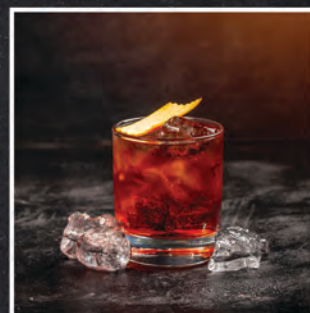
NEGRONI / 25 ZŁ

RUM, LIMONKA, MIĘTA, BRĄZOWY CUKIER, SODA TAKŻE W WERSJI XXL / 40 ZŁ