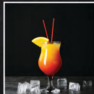
SEX ON THE BEACH / 25 ZŁ

TAKAMAKA KOKO, TAKAMAKA PINEAPPLE, SOK ANANASOWY, MLEKO, SYROP KOKOS