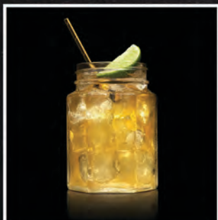
TROPICAL JIM / 50 ZŁ

JIM BEAM, TRIPLE SEC, PASSOA, SOK ANANAS, POMARAŃCZA, JABŁKO, PUREE MARAKUJA