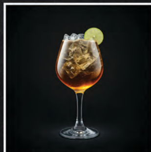
HUGO SPRITZ / 30 ZŁ

BALLANTINES WILD, PUREE WIŚNIOWE, SOK Z CYTRYNY, TUP