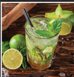
MOJITO / 26 ZŁ

RUM, LIMONKA, MIĘTA, BRĄZOWY CUKIER, SODA TAKŻE W WERSJI XXL / 40 ZŁ