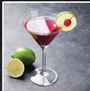
COSMOPOLITAN / 25 ZŁ

WÓDKA CYTRYNOWA, TRIPLE SEC, SOK ŻURAWINOWY, SOK Z LIMONKI