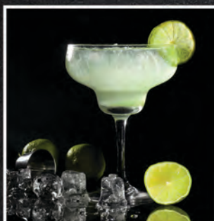
MARGARITA / 25 ZŁ

WÓDKA CYTRYNOWA, TRIPLE SEC, SOK ŻURAWINOWY, SOK Z LIMONKI