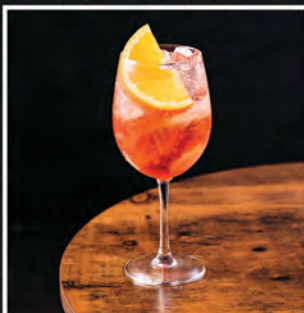
APEROL SPRITZ / 30 ZŁ

APEROL, PROSECCO, WODA GAZOWANA, POMARAŃCZA