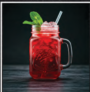
CHERRY LADY / 30 ZŁ

JIM BEAM, TRIPLE SEC, PASSOA, SOK ANANAS, POMARAŃCZA, JABŁKO, PUREE MARAKUJA