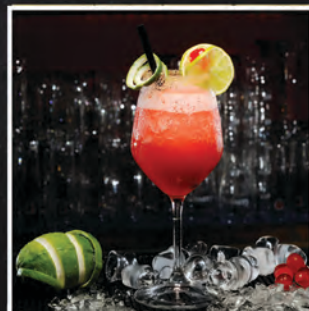
GRAPEFRUIT DAUQUIRI / 28 ZŁ

RUM, PUREE MARAKUJA, SYROP CUKROWY, SOK Z LIMONKI, SOK GREJPFROTOWY