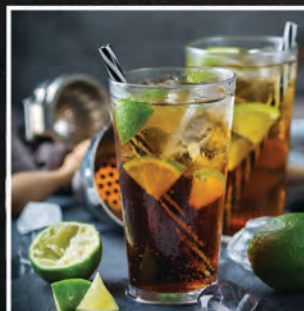
LONG ISLAND ICED TEA / 35 ZŁ

TEQUILA, WÓDKA, RUM, TRIPLE SEC, GIN, SOK Z CYTRYNY, PEPSI