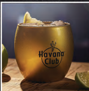
SEEIN' RED / 24 ZŁ