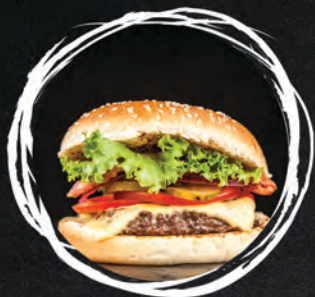
BURGER CLASSIC / 37 ZŁ MIĘSO WOŁOWE 200G / SAŁATA / POMIDOR / SER / CEBULA CZERWONA / SOS BBQ (1, 3, 6, 7, 8, 10, 11, 12)