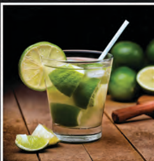
CAIPIRINHA / 25 ZŁ

APEROL, PROSECCO, WODA GAZOWANA, POMARAŃCZA