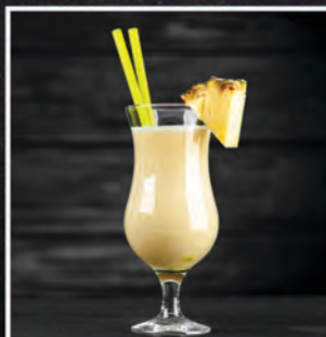
PINA COLADA / 30 ZŁ

TEQUILA, WÓDKA, RUM, TRIPLE SEC, GIN, SOK Z CYTRYNY, PEPSI