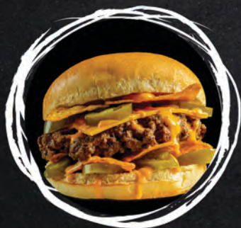
NACHOS BURGER / 42 ZŁ MIĘSO WOŁOWE 200G / SAŁATA / SER / CHORIZO / NACHOS / JALAPENO / CZERWONA CEBULA / POMIDOR / SOS GUACAMOLE (1, 3, 6, 7, 8, 10, 11, 12)