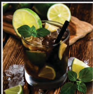
CUBA LIBRE / 25 ZŁ