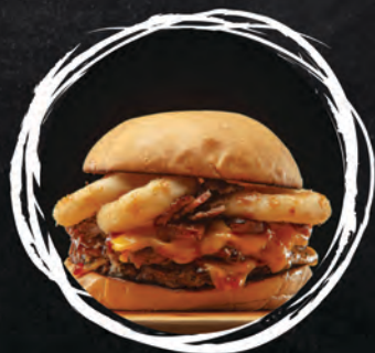
ONION BURGER / 41 ZŁ MIĘSO WOŁOWE 200G / SAŁATA / SER / BEKON / KRAŻKI CEBULOWE / POMIDOR / SOS MAYO SRIRACHA (1, 3, 6, 7, 8, 10, 11, 12)