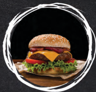
BURGER FIRMOWY / 42 ZŁ MIĘSO WOŁOWE 200G / SAŁATA / SER / JALAPENO / PIKLE / BEKON / CEBULA PRAŻONA / SOS AUTORSKI (1, 3, 6, 7, 8, 10, 11, 12)