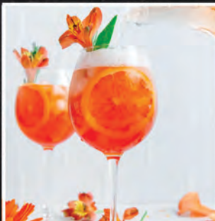
ROSE TEQUILA / 40 ZŁ

TEQUILA, TRIPLE SEC, SYROP WANILIA, SOUR MIX, PUREE PASSION FRUIT, MIĘTA, LIMONKA, PROSECCO